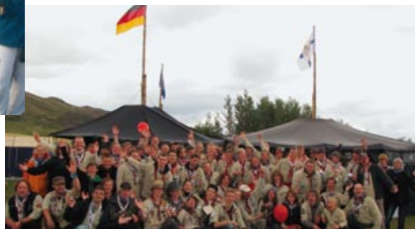
Das DPSG-Kontingent auf dem Roverway